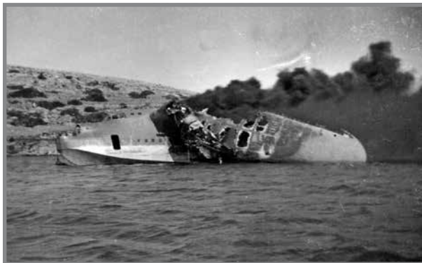
L-arjuplan Short Sunderland jaqbad fil-Bajja tal-Mistra wara li ġie mmaxingjat mill-ajruplani Germaniżi.

Leli jsemmi li fil-bajja tal-Mistra kien hemm żewġ ajruplani tal-baħar Ingliżi Short Sunderlands. Dawn kienu jintużaw biex ifittxu s-sottomarini tal-għadu, fost affarijiet oħra. Darba, waqt li kien sejjer l-iskola, ra żewġ ajruplani Ġermaniżi qishom tikka fis-smewwiet, iduru dawra mejt. Leli fettillu li dawn il-Ġermaniżi kellhom għalih u kif rahom jogħdsu kien pront stahba ġo kmajra tas-sejjeħ. Imma l-għadu kellu f'moħħu l-ajruplani tal-baħar, mhux lil Leli. Sema' xebgħa sparar u għalkemm xtaq jibqa' jinvestiga, sema' jidwi ġo moħħu l-kliem tas-surmast u reġa' qabad triqtu lejn l-iskola. Wara, xi ħadd qallu li wieħed mill-ajruplani Ingliżi kien intlaqat, ħa n-nar u għereq fil-bajja. Leli jsemmi wkoll li fil-Mistra kien hemm tinda kbira fejn kienu jinżammu dawn is-Sunderlands meta jittellgħu l-art. Wara l-gwerra, il-fdalijiet tal-ajruplan mgħarraġ ġew sploduti biex titnaddaf il-bajja.