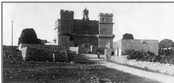
Il-Palazz ta' Selmun, iċ-Ċikken u l-irziezet qabel it-Tieni Gwerra Dinjija. Dawħ li qishom sigar huma fil-fatt munzelli ta' silla jew ħatab maħżuna fuq l-irziezet. L-arblu tat-telefon fuq ix-xellug huwa dak li kien jindilek bix-xaħam għall-kukkanja fil-festa.

minnhom, fejn ir-razzett tan-Naħlu, ra munzell 'imbarazz'. Induna li kienu l-fdalijiet tal-artal tal-kappella tal-Palazz; kienu farrkuħ dawħ li ħadu l-Palazz taħt idejhom biex ikunu jistgħu jdeffsu xi zewg imwejjed oħra fil-maqdes, li issa kien inbidel f'restorant. 19