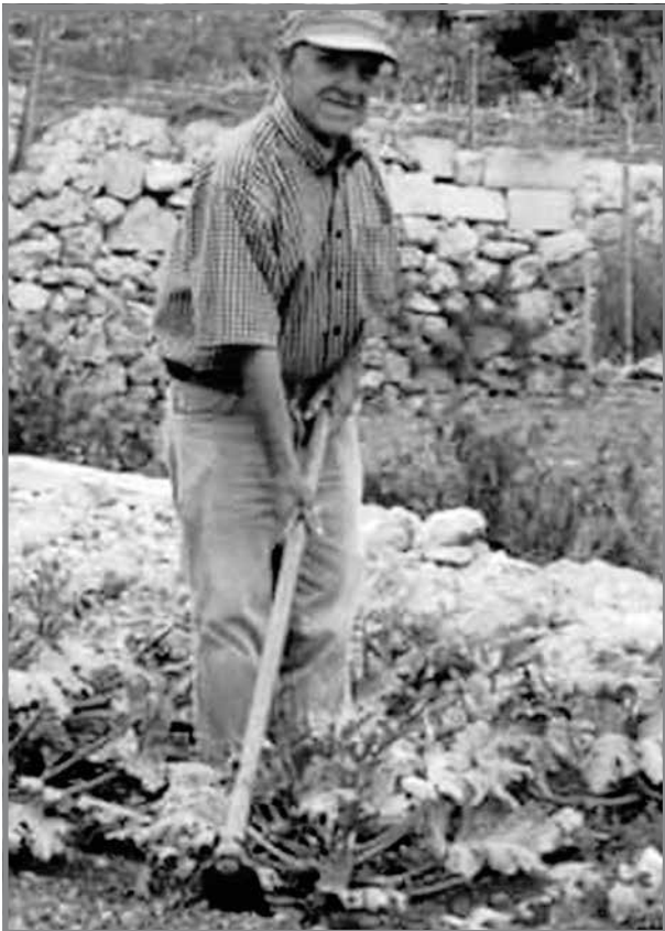
Leli Vella l-Blaj fir-raba'.

Imbagħad kien hemm dik l-imbierka dictation.